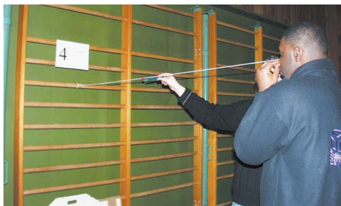
Prüfung der Fixationsgenauigkeit mittels Perlkettentrainer

Ein weiterer Test zur Prüfung der Augenkoordination fand mit dem Perlkettentrainer statt. Die etwa 1,5 Meter lange Schnur ist an einem Ende an der Wand befestigt, das andere Ende hält sich