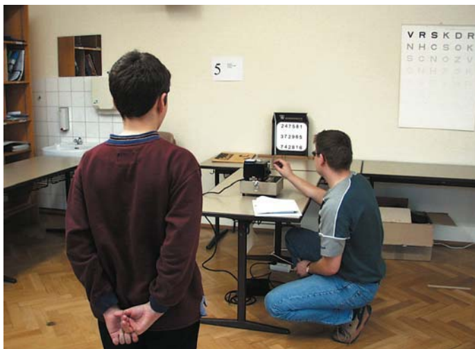
Prüfung der zentralen Wahrnehmung mit dem Tachistoskop

Zur Beurteilung der zentralen Erkennungsleistung wurde ein Tachistoskop eingesetzt. Mit dem Tachistoskop werden Dias mit Zahlen für die Dauer von 1/10 Sekunde auf eine Leinwand geblitzt. Der Proband muss sich möglichst viele der Zahlen merken